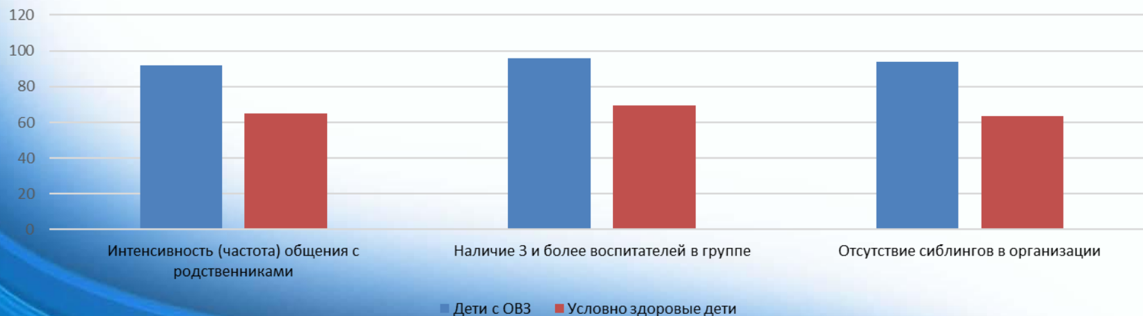
Удовлетворенность возможностью осуществить свои намерения

Дети-сироты с ОВЗ более удовлетворены системой своих отношений с окружающими в организации, что связано с наличием и количеством значимых взрослых, которые за ними ухаживают и помогают осуществлять их намерения.